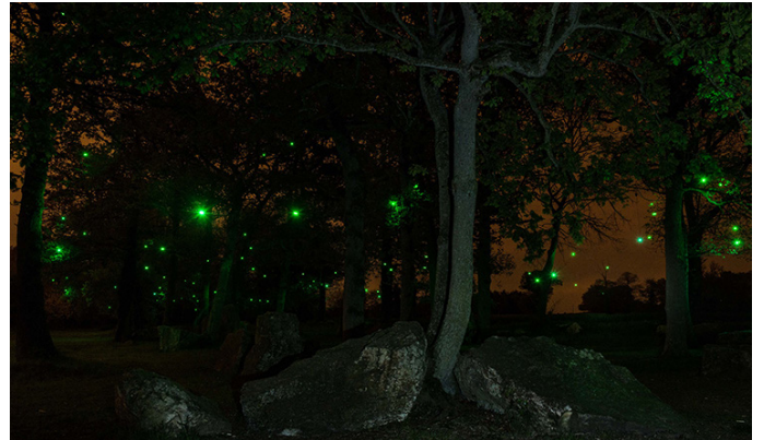
Erik Samakh, Les fées lucioles , L'Art au fil de la Rance, site des mégalithes, Peslin Trigavou, 2016. © Erik Samakh

Donnant ainsi au public l'impression de voir, selon les angles et les profondeurs, une nuée de lucioles s'animer dans les arbres.