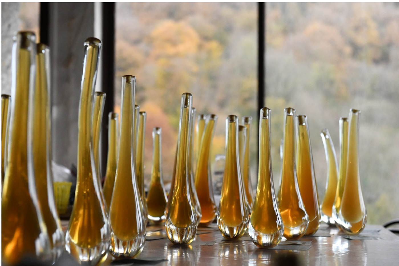
Erik Samakh, Goutte de miel dans l'atelier après remplissage et fermeture à la cire d'abeille , Atelier de l'artiste, 2018. © Erik Samakh.