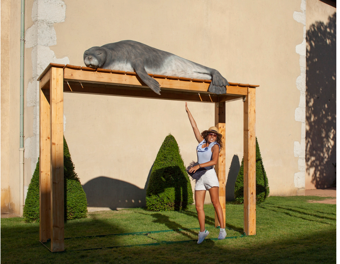
Victoria Klotz, Les hôtes du logis, Phoque . Exposition Paysages , Annecy, 2018.