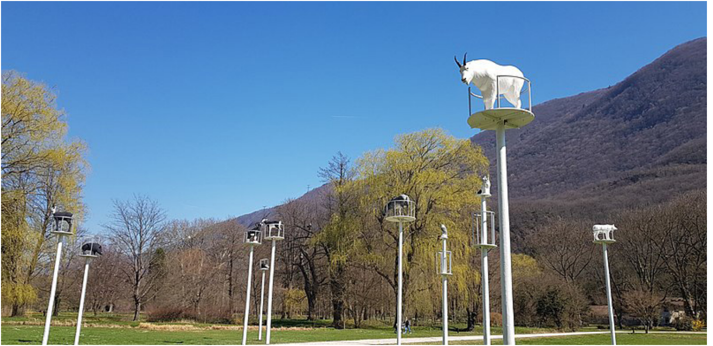
Victoria Klotz, Les sentinelles , Domaine de Vizille, Isère, 2019. © Victoria Klotz.