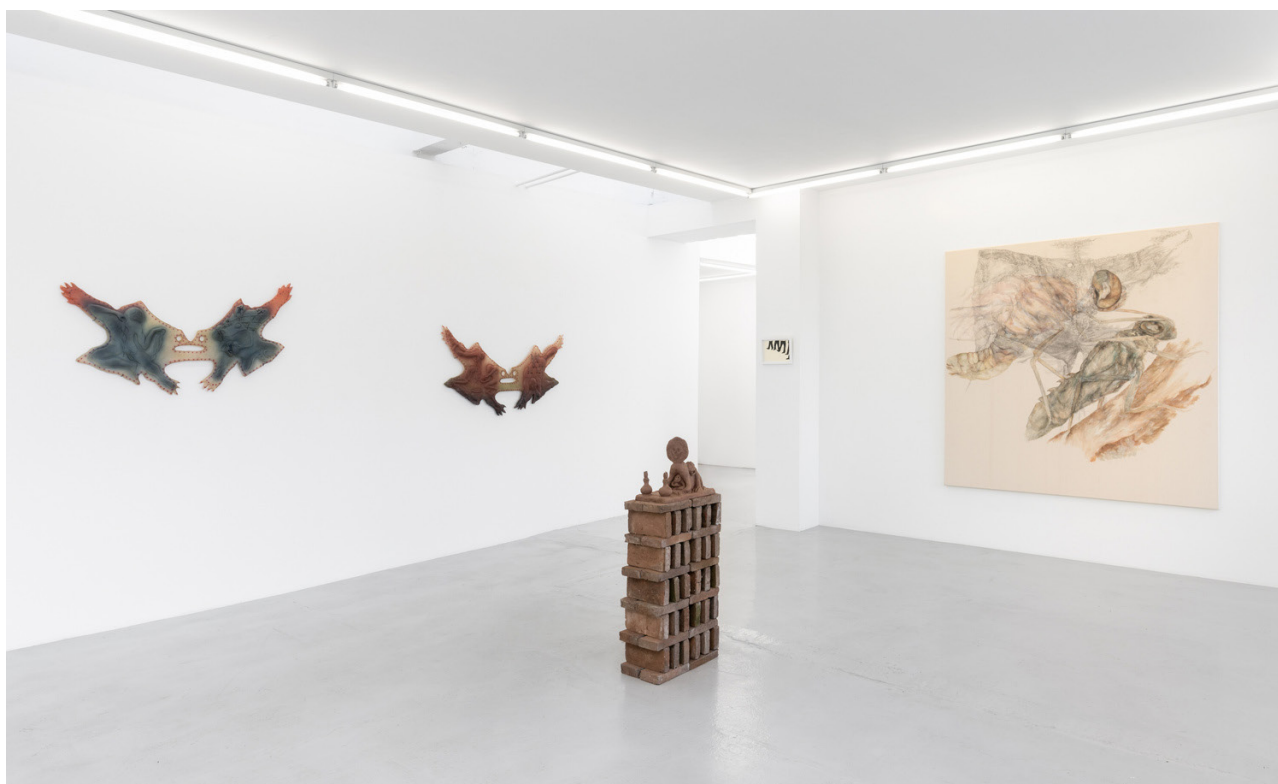
The sun rises in peculiar ways , Gether Contemporary, Copenhagen (DK), installation view