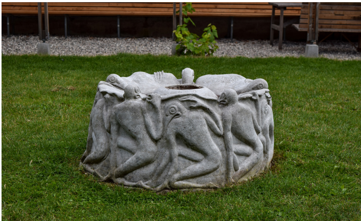
Bird bath no. 4 , 2019 65 x 95 x 95 cm, concrete From The first annual open air show, KIKhhs, Roskilde (DK)