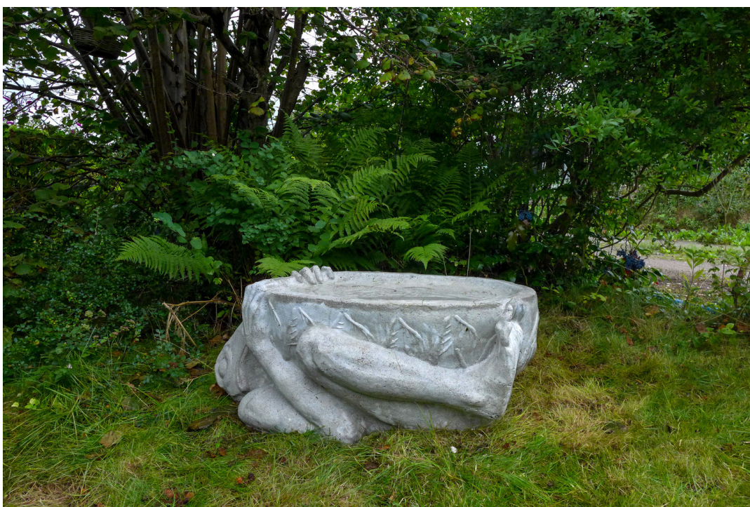
Bird bath no. 5 , 2019 45 x 95 x 65 cm, concrete from Kolonien, Kunstforeningen Kolonien, Herlev (DK)