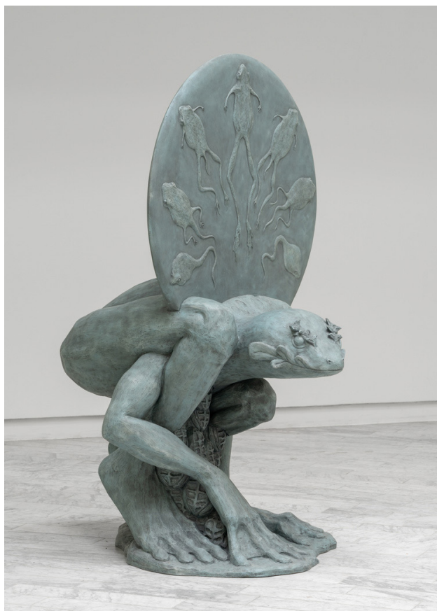
Upstreamer , 2023 190 x 115 x 125 cm, resin, paint Photo © David Stjernholm from Eco Fan, Tranen Contemporary Art Center, Hellerup (DK)