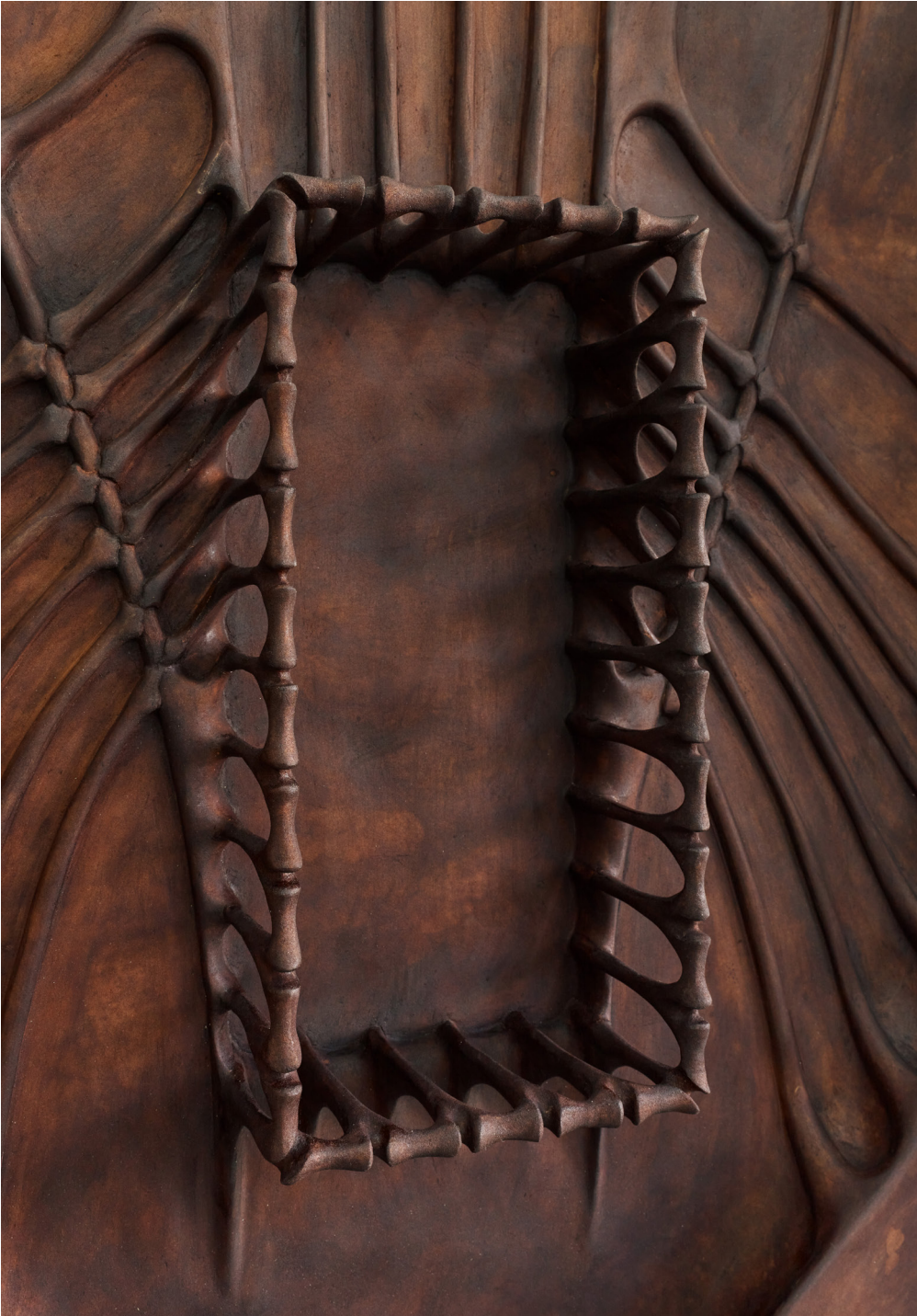
Chest IV , 2025 210 x 90 x 21 cm, hand-carved pu-foam, taint, shellac, aluminium, foam, pu-resin