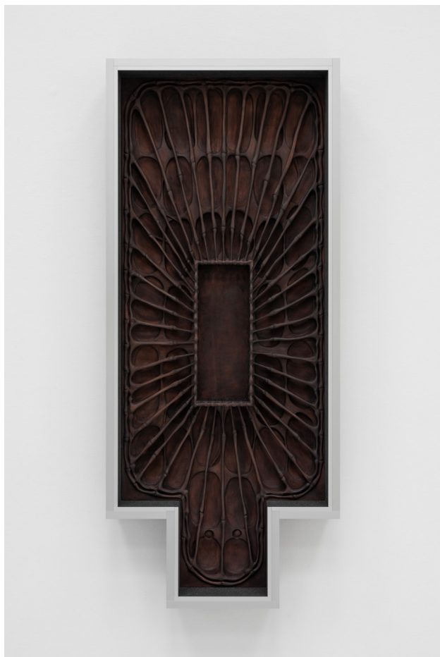
Chest, 2025 210 x 90 x 21 cm, hand-carved pu-foam, taint, shellac, aluminium, foam, pu-resin