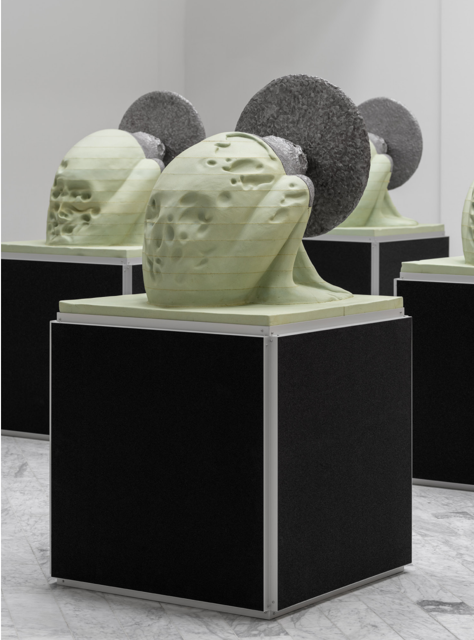
Ansekt , 2025 165 x 86 x 86 cm, hand-carved pu-foam, glue, varnish, cast acrylic, aluminium coating, taint, aluminium, foam, pla