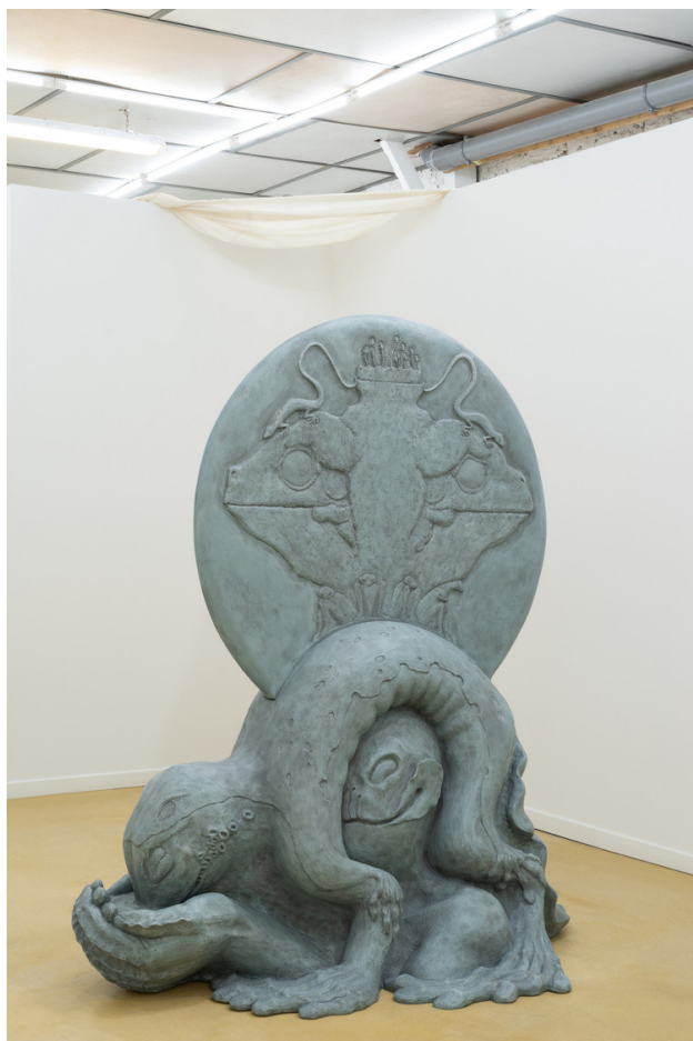
Keeper , 2023 170 x 150 x 115 cm, resin, paint from Riparia, The Community Center, Pantin (FR)