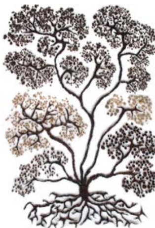
L'arbre de vie © Laëtitia Bourget

occupent l'espace d'exposition entièrement dédié à l'éloge du phénomène de la vie : son déploiement, ses hybridations adaptatives, sa temporalité, ses cycles de régénération, son empreinte, son enracinement, sa reproductibilité sexuée et la circulation des substances nourricières. On y rencontre d'étranges créatures animées (vidéos), composées de différentes parties du corps humain, évoluant chacune dans un milieu particulier. Il y a aussi des objets domestiques (tapis, couverture) confectionnés à partir de poils humains et d'animaux entremêlés. Sur