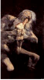
* Goya, Saturne dévorant ses enfants . 1823, huile sur toile, 146 x 83cm

Les ravages du temps traversent toute l'œuvre de Goya. Dans cette oeuvre d'une grande violence, le temps est personnifié en colosse surgissant de la nuit et dévorant un être humain.